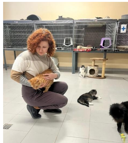
Bild1: Rigabon Anita har precis varit och hämtat sin nya familjemedlem, den brunvita och just nu lite nervösa skönheten Late.

Bild 2: I katternas rum finns det möjlighet att klättra, busa och gå ut på den lilla altanen, och vid behov kan alla dra sig undan i sina egna burar.